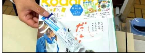
レジサンプリング p.9