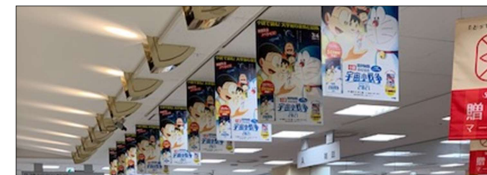
天吊りポスター/ポスター p.15