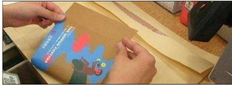
ブックカバー・しおり p.8