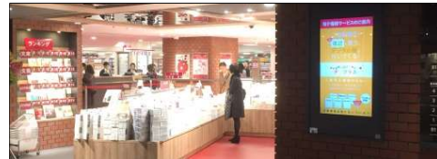
デジタルサイネージ p.14